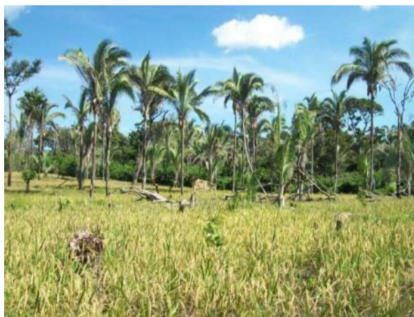
Figura 3. As imponentes palmeiras-babaçu em meio à roça de arroz.