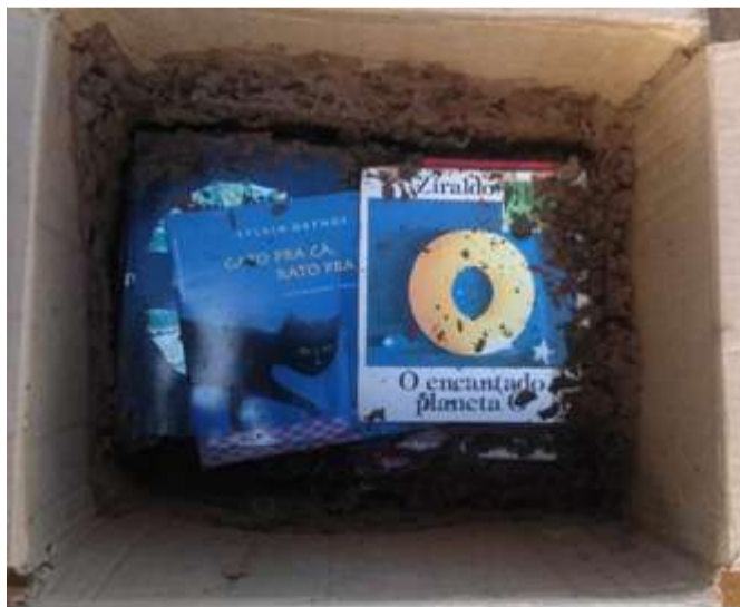
Figura 5. Os cupins devoram tudo da noite para o dia.