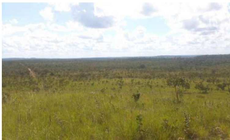
Figura 2. Vista panorâmica da TI Parabubure, uma ilha de vegetação em meio ao agronegócio, cortada pela principal estrada de acesso às aldeias