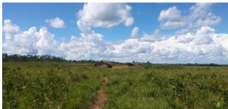
Figura 3. Vista panorâmica parcial da Daritidzé no caminho de volta do rio, em meio ao campo de cerrado.